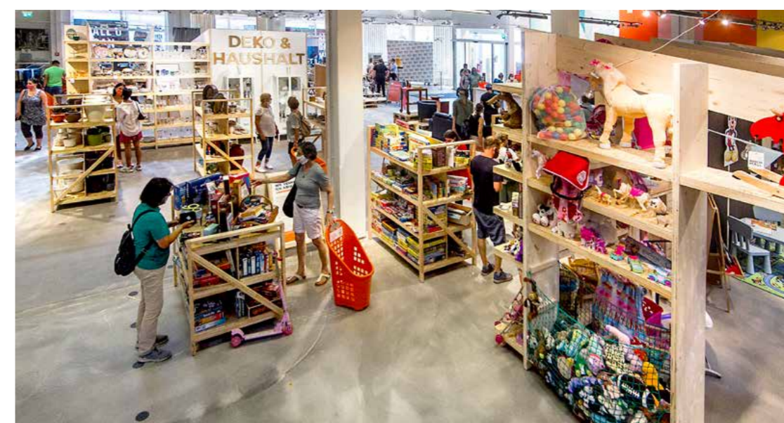
Die NochMall in Reinickendorf: Vorbeischaun lohnt sich.

bereits heute Verantwortung, um die Zukunft nachhaltig mitzugestalten und die Vision einer klimaneutralen und lebenswerten Zero-Waste-Hauptstadt Berlin Schritt für Schritt zu verwirklichen. Um die Bürgerinnen und Bürger auf diesem Weg mitzunehmen, entwickeln wir weiterhin Kampagnen für Stadtsauberkeit und einen nachhaltigen Lebensstil, aber auch konkrete Angebote für mehr Re-Use, Recycling und null Verschwendung. Gleichzeitig stellen wir uns als Unternehmen den Herausforderungen der Digitalisierung und unterstreichen mit Veranstaltungen wie der „Future Work Week“ die Attraktivität der BSR als Arbeitgeberin – auch im Bereich IT. Denn nur wenn es gelingt, auch künftig geeignete Fachkräfte für uns zu begeistern, können wir die Aufgaben von morgen gemeinsam stemmen. □