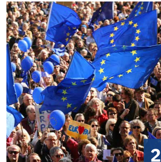
Europa geht uns alle an!