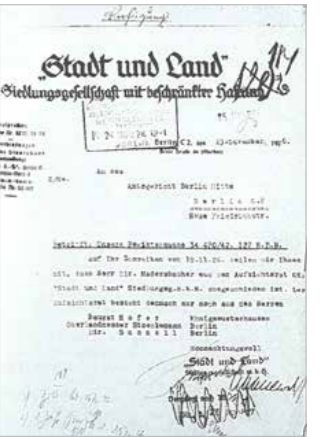
Historisches Dokument: die Gründungsurkunde der „Markischen Scholle“, dem Vorläuferunternehmen der heutigen STADT UND LAND.

100 Jahre STADT UND LAND – gegründet, um in der Weimarer Republik Familien ein menschenwürdiges Zuhause zu geben, mit Licht, Luft und Sonne. Auch heute kümmert sich die STADT UND LAND um den Bau neuer Wohnungen, die deutlich größer, komfortabler und altersgerechter sind als in früheren Jahrzehnten; zur Linderung der Wohnungsknappheit unserer Tage, mit Fokus auf Berlin. Es bestehen allerdings neue Herausforderungen, um die Balance zwischen Klimaschutz, Bestandsanierung, Neubau und dem sozialen Zusammenhalt zu gewährleisten – die STADT UND LAND leistet hier auch weiterhin ihren Beitrag. □