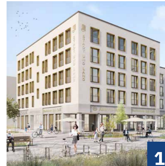
Die Buckower Felder

Aus Gründen der besseren Lesbarkeit wird in diesem Magazin bei Personenbezeichnungen und personenbezogenen Hauptwörtern die männliche Form verwendet. Entsprechende Begriffe gelten grundsätzlich für alle Geschlechter. Die verkürzte Sprachform beinhaltet keine Wertung.