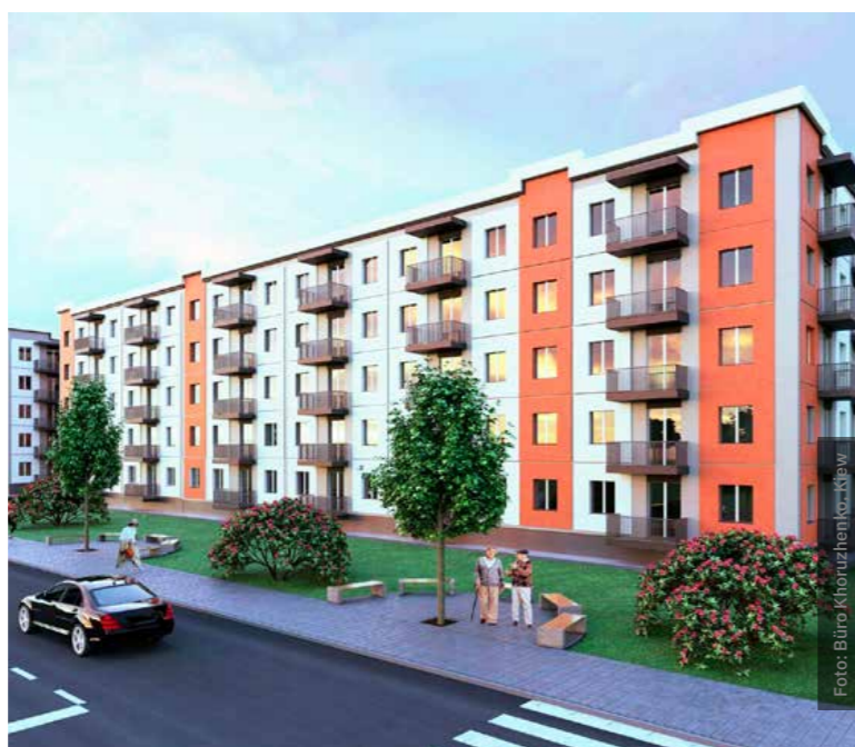
Die Visualisierung zeigt, wie später die Typenhäuser aussehen könnten.

→ Mehr dazu unter www.stadtundland.de/typenhaus