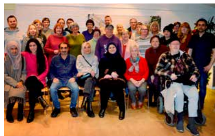
Ein Dankeschön an die vielen ehrenamtlichen Kräfte!