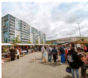
Der Kieztrödel im Kosmosviertel – von den Nachbarn organisiert.

Doch bei den größeren Veranstaltungen soll es nicht bleiben. Viele Aktionen, die von Nachbarn für Nachbarn organisiert wurden, haben das Kosmosviertel in den vergangenen Jahren lebendiger gemacht. Von Trödelmärkten, Hoffesten, Familiennachmittagen bis zu Graffiti- und Bepflanzungsaktionen ist fast alles möglich. Daher ist erst mal keine Idee zu verrückt! Wer zudem gerne etwas mit und für seine Nachbarn organisieren möchte, bekommt auch Unterstützung. Im Quartiersmanagement können im Aktionsfonds auch in diesem Jahr wieder Anträge für bis zu 1.500 Euro gestellt werden. Insgesamt stehen dafür 10.000 Euro zur Verfügung sowie weitere 10.000 Euro für Ideen, die mit Umwelt-, Natur- und Klimaschutz zu tun haben. Außerdem stehen das Team des Quartiersmanagements, der Quartiersrat und auch andere Einrichtungen mit Rat und Tat zur Seite. Also keine falsche Bescheidenheit und Zurückhaltung! Kommen Sie vorbei mit Ihren Ideen für eine gute Nachbarschaft. Gemeinsam finden wir dann einen Weg. □