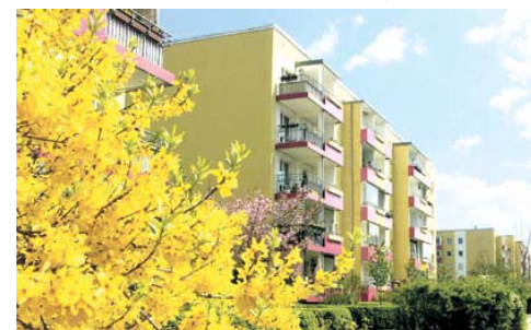
Frühling an der Louis-Lewin-Straße

Insgesamt hegt und pflegt die STADT UND LAND/WoGeHe in Hellersdorf rund 411.000 Quadratmeter Grünfläche. Dazu zählen vor allem 80 Innenhöfe mit den dazugehörigen Spielflächen, um deren „Seelenheil“ sich die Grüninspektoren kümmern. Die Vielfalt der Flora, die man in der Großsiedlung antrifft, dürfte manchen überraschen. Rund 5.350 Bäume stehen auf den Grundstücken der STADT UND LAND, darunter Ahorn, Linde, Pappel, Eberesche, Eiche, Walnuss, Kirsche und Apfel. Mehrere Kilometer Hecken aus Ahorn, Buche, Liguster, Spiere und Mahonia zieren Höfe, Vorgärten und Wege. Eine Augenweide sind auch die meisten der 600 Mietergärten, die von den Bewohnern mit Liebe und viel Ideen gestaltet werden.