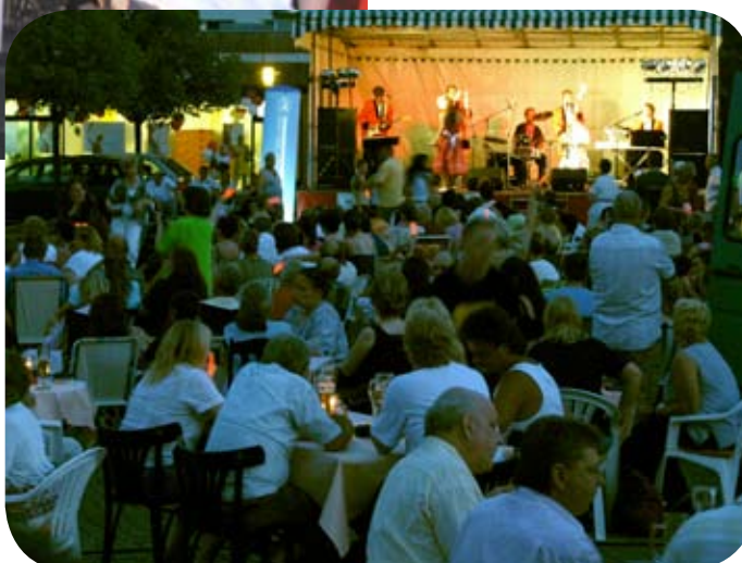
rechts: Schon beim Auftakt mit fetzigem Rock war der Platz rappelvoll