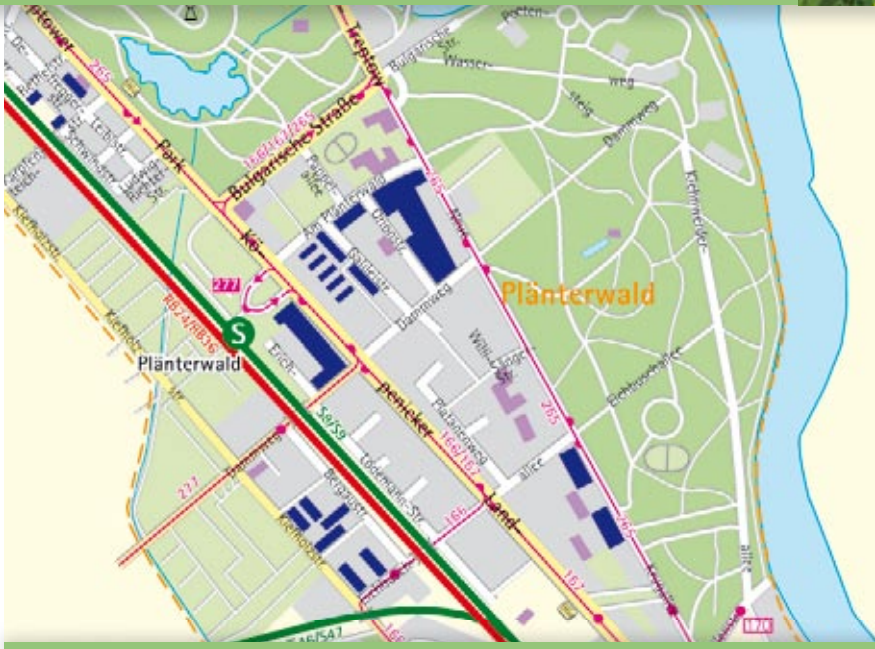
■ Häuser der STADT UND LAND

Wer möchte, kann einen Pkw-Stellplatz anmieten. Im Wohnumfeld laden gepflegte Grünanlagen zur Entspannung oder zum nachbarschaftlichen Plausch. Und ganz in der Nähe kann man im Plänterwalder Forst auf 89 Hek-