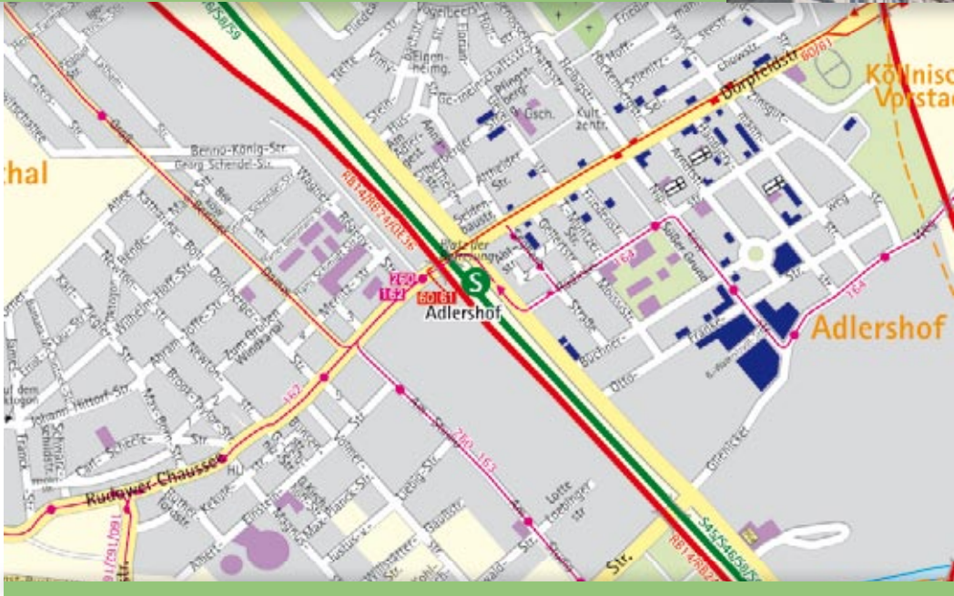
■ Häuser der STADT UND LAND

Wer sich für Adlershof entscheidet, entscheidet sich für pulsierendes Leben mit einer abwechslungsreichen Geschäftsstraße und großzügigen Grünanlagen, mit Spielplätzen, Kindergärten und Schulen. Ein Wohnstandort, der in vielerlei Hinsicht Lebensqualität und Zukunftssicherheit verspricht.