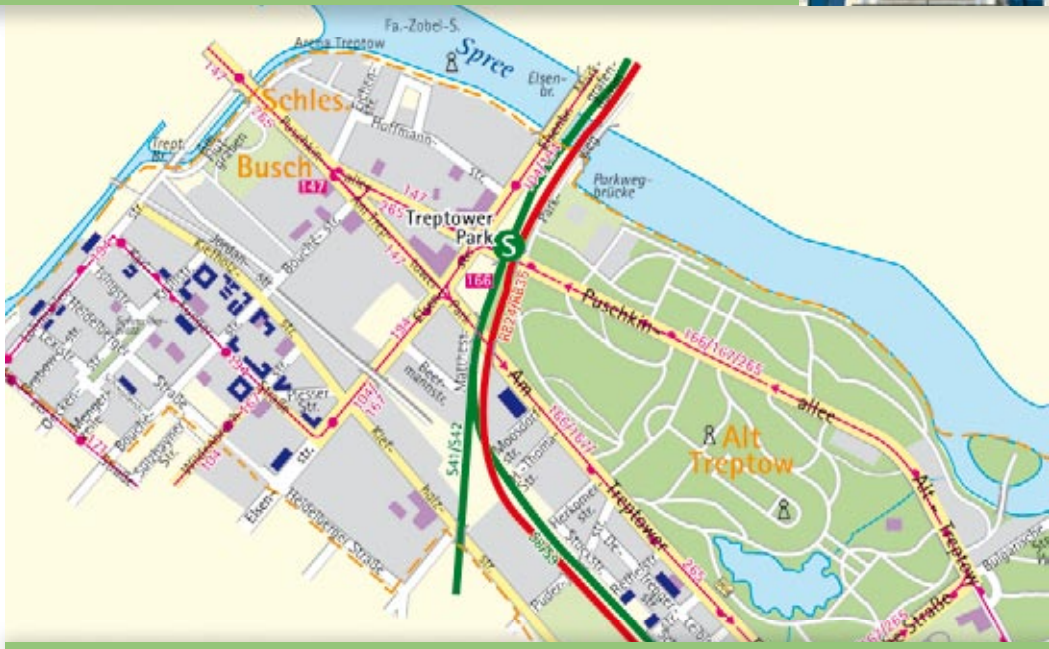
■ Häuser der STADT UND LAND

D er Kiez bietet in unmittelbarer Umgebung alles, was man zum Leben braucht, und noch viel mehr. Zum Shoppen lädt neben zahlreichen Einzelhandelsgeschäften das nahe gelegene Park Center am S-Bahnhof Treptower Park ein.