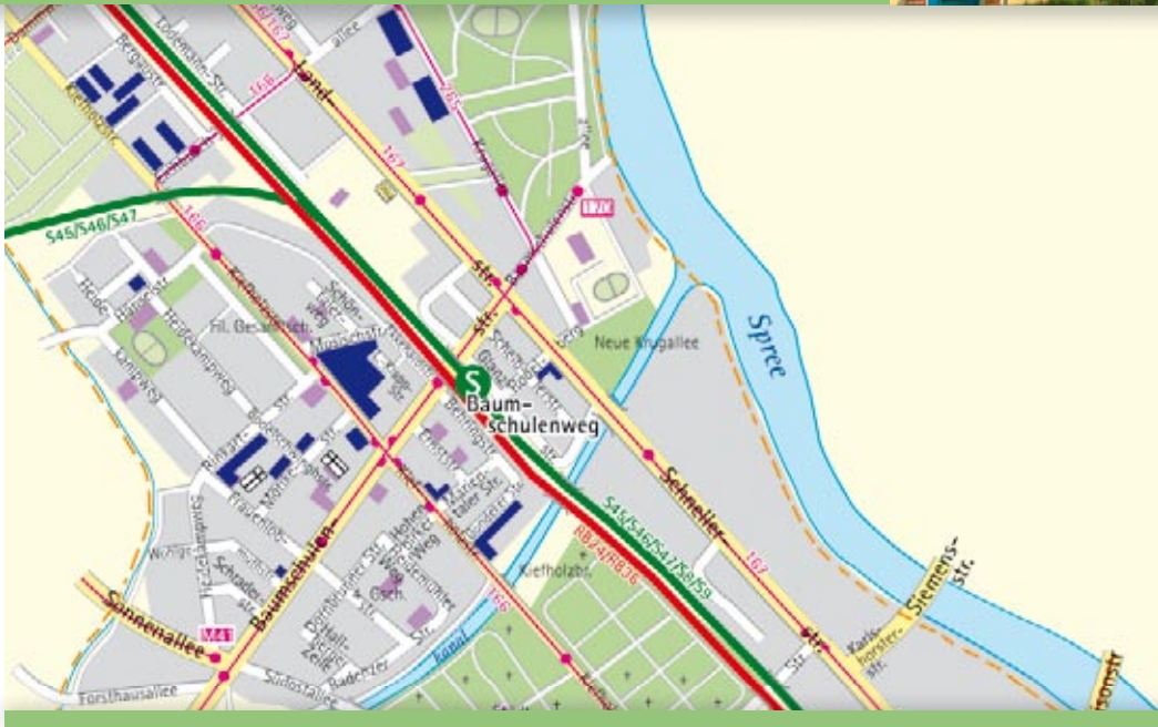
■ Häuser der STADT UND LAND

I m Wohnumfeld laden parkähnliche Grünanlagen und begrünte Innenhöfe zur Entspannung oder zum nachbarschaftlichen Plausch. Zum Shoppen und Verweilen bieten sich die Geschäfte und Cafés in der Baumschulenstraße an.