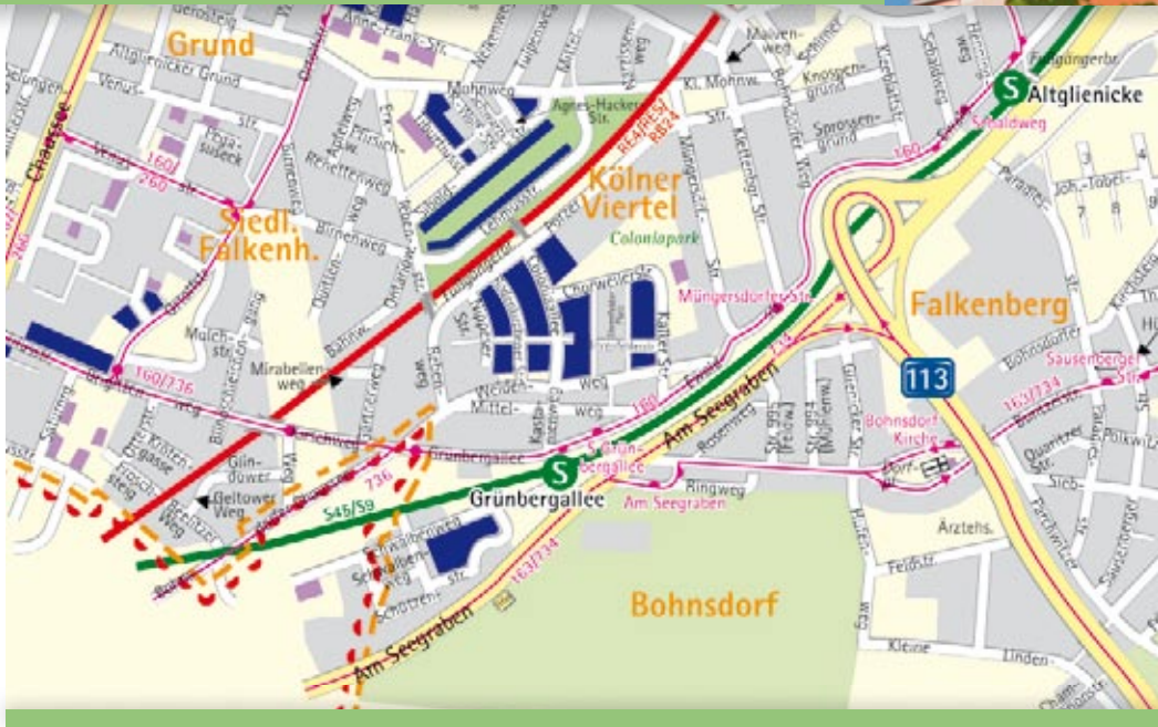
■ Häuser der STADT UND LAND

Die Jüngsten sind in den vier Kindertageseinrichtungen in Bohnsdorf bestens aufgehoben. Eine Grundschule, eine Realschule und ein Gymnasium zählen zu den Bohnsdorfer Bildungseinrichtungen für die Heranwachsenden.