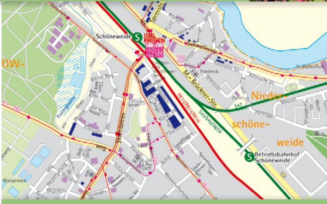
■ Häuser der STADT UND LAND

K indergärten, Schulen und medizinische Einrichtungen sind im Wohnumfeld ebenso vorhanden wie diverse Einkaufsmöglichkeiten.