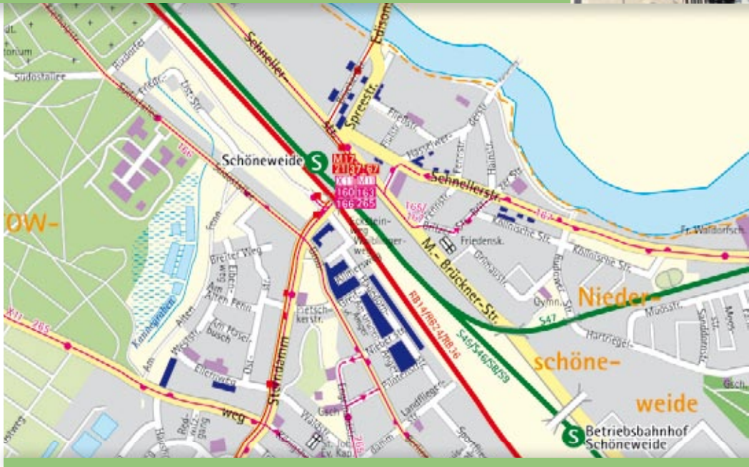
■ Häuser der STADT UND LAND

N iederschöneweide ist auch für den Alltag bestens geeignet – dank vieler Einzelhandelsgeschäfte und Gaststätten, dem Zentrum Schöneweide und qualifizierter medizinischer Einrichtungen.