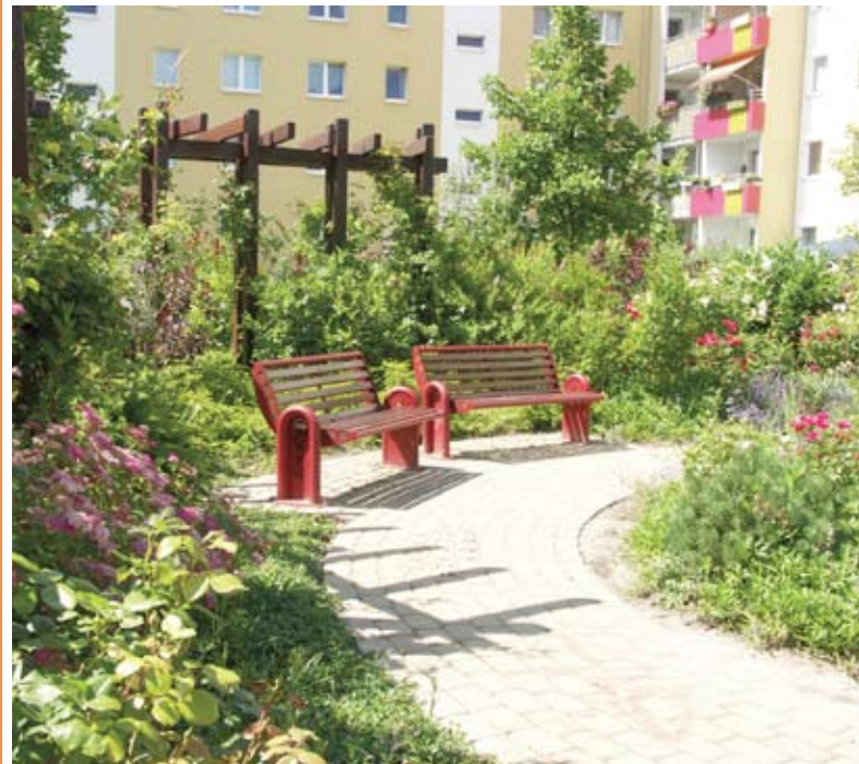
Individuelle Hofgestaltung im Branitzer Karree

um die Bewusstseinsbildung bei den Mitbewohnern mit Blick auf intakte Wohnhöfe, Grünanlagen, Spielplätze, Vorgärten usw. kümmern. Das