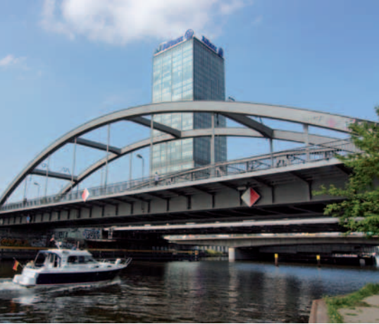
Ein Wahrzeichen des modernen Berlins: Die Treptowers an der Spree.

In den Jahren 1821/22 errichtete Langhans d. J. an der Stelle eines einstigen Fischerhauses und späteren Vorwerks im Stil von Schinkel das Gasthaus an der Spree, das ab 1889 unter